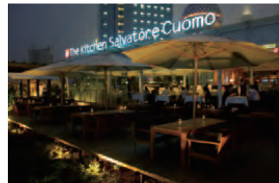
The Kitchen Salvatore Cuomo SHANGHAI