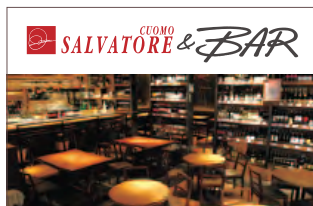
SALVATORE CUOMO & BAR

ナポリピッツァを日本に広めた功労者サルヴァトーレ・クオモがプロデュースするピッツェリア。イタリアの職人が造ったピッツァ窯の中で焼き上げるナポリピッツァは、薄生地なのにもちもちで、薪の香りも美味しい逸品です。この本場ナポリの味をایتンだけでなくデリバリーサービスでご家庭までお届けします。ご家族、仲間同士のディナーやパーティーを、わいわい楽しくイタリアンスタイルでお楽しみください。