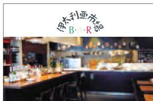
伊太利亜市場 B・A・R (イタリアイチバ バー)

ピッツァだけではなくサルヴァトーレの新しいスタイル。気軽にワインやビールを楽しんで頂けるよう、ピッツァはもちろん、旬のアンティパストや炭火串焼、グリル料理などの“おつまみ”が充実しています。またワインのラインナップもイタリアのものを中心に世界中から厳選し、リーズナブルに取り揃え、様々なシーンで気軽にお使いいただけます。