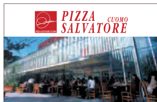
PIZZA SALVATORE CUOMO (ピッツァ サルヴァトーレ クオモ)

雰囲気もメニューもますます充実しており、変わらない本物の味はデリバリーでもお楽しみいただけます。是非一度、店舗・ご家庭でお召し上がりください。